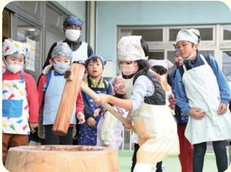
全員が順番にお餅をつきました。