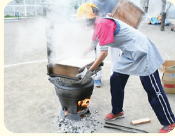
園庭で餅米をせいろで蒸して、臼に移します。