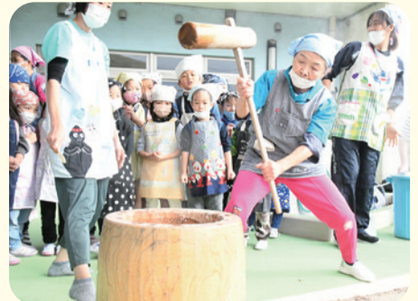
保育士が、手本でお餅をつきます。