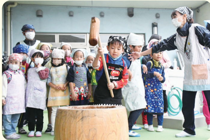
年長児が花餅を作る様子を年中児が見学しました。