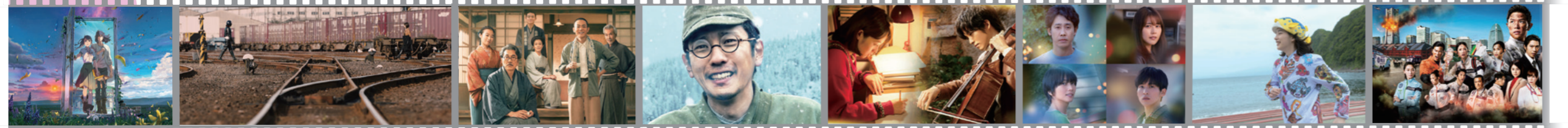
©2022「すずめの戸締まり」製作委員会 ©石森プロ・東映/2023「シン・仮面ライダー」製作委員会 ©2022映画「銀河鉄道の父」製作委員会 ©2022「ラーゲリより愛を込めて」製作委員会 ©松本あおい/集英社 ©2022「耳をすませば」製作委員会 ©2022「月の満ち欠け」製作委員会 ©2022「さかなのこ」製作委員会 ©2023劇場版「TOKYO MER」製作委員会

(株)東京現像所が閉所する前に、図書館で独自に記録写真撮影とインタビューを行いました。技術者たちの仕事をご覧ください。 2月10日(日)~18日(日) 午前10時~午後7時 文化会館たづくり2階南ギャラリー