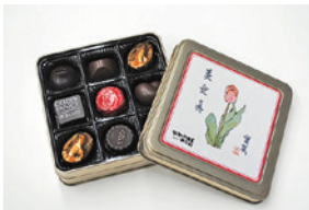
2024年限定チョコレート

㊟ 1月20日(出)～ 価格/650円(税込) 販売場所/実篤記念館窓口、市内複数施設(詳細は実篤記念館まで要問い合わせ) 予約・発送/実篤記念館でのみ個数限定取り扱い。1月20日(出)午前9時から電話で受け付け。予約分の受け渡し・発送は2月1日(休)から順次実施(送料は別途必要)