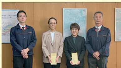
寄付贈呈式の様子

12月22日、(株)浜食が「第49回浜食祭りチャリティーバザー」の売上金を、NPO法人高次脳機能障がい者活動センター調布ドリームとNPO法人青少年の居場所Kiitosに寄付しました。 この寄付活動は、昭和47年から始まり今回で49回目です。 両事業所は、この寄付で運動用マット、オープンレンジなどの備品を購入し、事業の充実を図りたいと話しました。(障害福祉課)