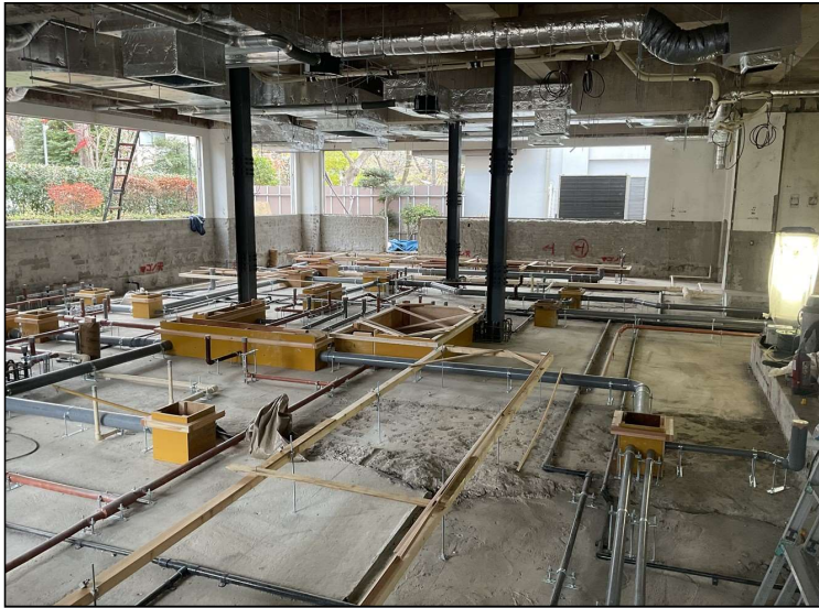
No.1 調布市立深大寺小学校給食室改修工事 調理室内 施工状況