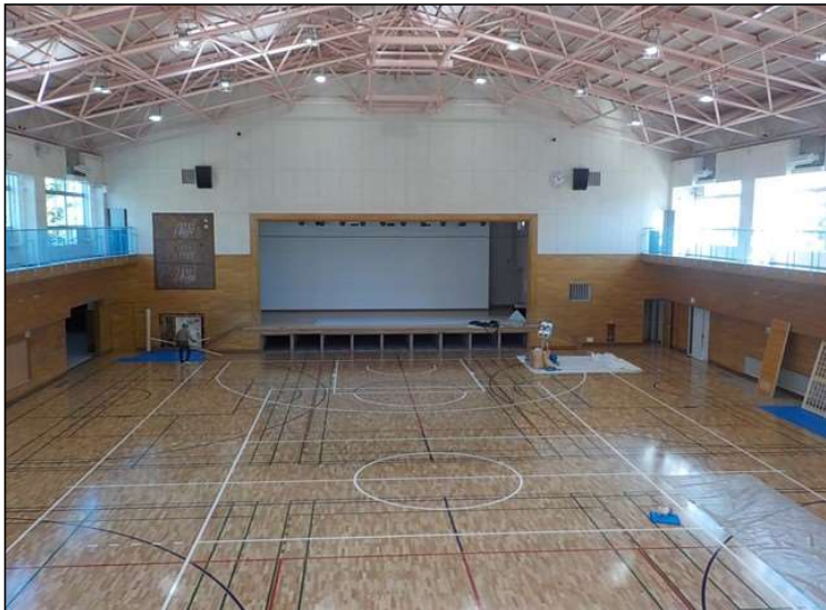
No.2 調布市立第三中学校第一体育館改修工事 アリーナ床フローリング 施工完了