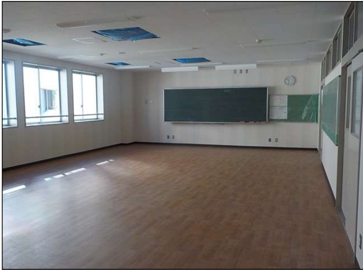
No.4 調布市立北ノ台小学校特別支援学級教室整備工事 内装 施工状況