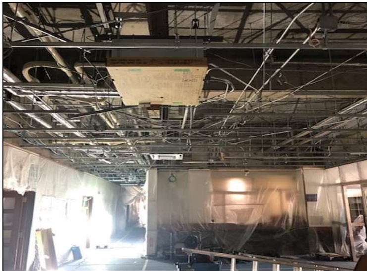
No.5 調布市八ヶ岳少年自然の家空調設備ほか改修工事 空調機設置 施工状況