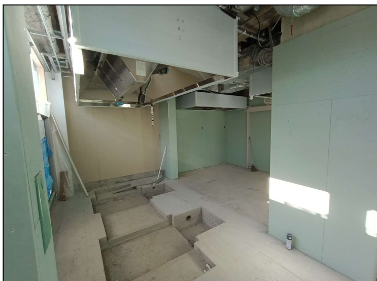
No.3 調布市立石原小学校給食室改修工事 調理室内 施工状況