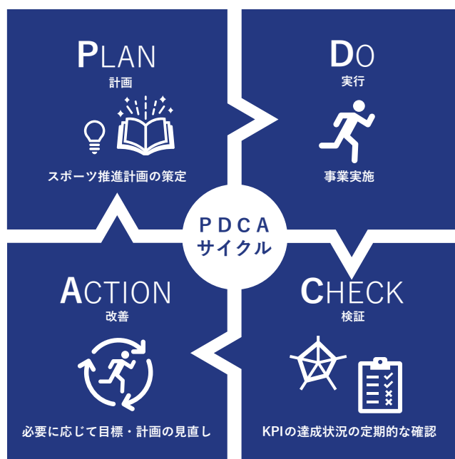
図表 47 PDCA サイクルのイメージ

こうした取組の実施状況の確認を踏まえ、必要に応じて計画の見直しを行っていくことで、PDCAサイクル 48 を活用した計画推進に取り組んでいくこととします。