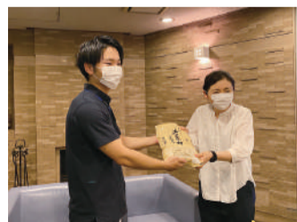
電気通信大学での贈呈の様子