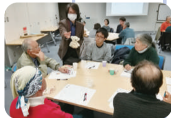
サイエンスカフェChofu

電通大だけでなく、市内や近隣にある大学・研究機関の研究者と、身近なテーマでサイエンスの楽しさについて気軽に話し合うことができます。