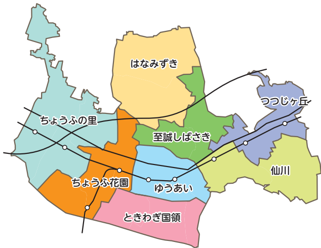
<地域包括支援センターの新たな担当地域>