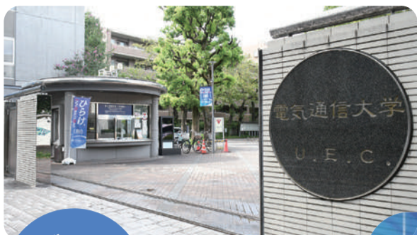
電気通信大学正門