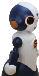
対話型ロボットSota(ソータ) Sota(ソータ)はヴイストン株式会社の登録商標です

ほかにも、「プログラミング教室(小学5年~高校3年生)」「理系の古文書講座」「ハイデガー『存在と時間』を読む」など知的好奇心をくすぐられる企画が年間を通じて用意されています。