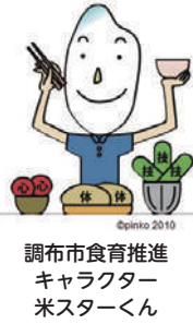
調布市食育推進キャラクター マイスターくん

受講期間／8月1日(出)～31日(月) 課題提出期限／8月31日(月) (必着) 市内在住・在学の小学4・5年生 参加者に送付する講座テキストで学習し、確認のワークシートを健康推進課へ提出すると食育マイスターに認定