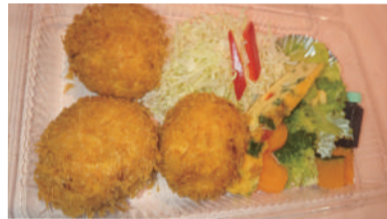
カニクリームコロッケ

人気のオムライスや、手間暇かけて作り上げたカニクリームコロッケ、200gハンバーグステーキをテイクアウト特別価格で終日提供しています。すでに毎週ご利用くださるお客様もいて嬉しい限りです。