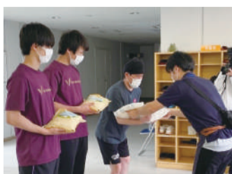
明治大学での贈呈の様子