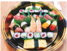
握りメニューの一例

売上よりもまずは安全対策として、宴会場の席にパーテーションを置き、ゆったりとしたスペース作りや、店舗の換気に努めています。