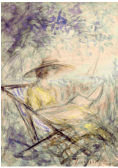
ピエール=ラブラード「休息」