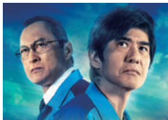
「Fukushima 50」(フクシマフィフティ) ©2020 「Fukushima 50」製作委員会 3月6日(金)全国公開 配給: 松竹 KADOKAWA

Fukushima 50(2020年/122分/DCP) 1400円(全席指定) チケット販売開始日/1月24日(金)