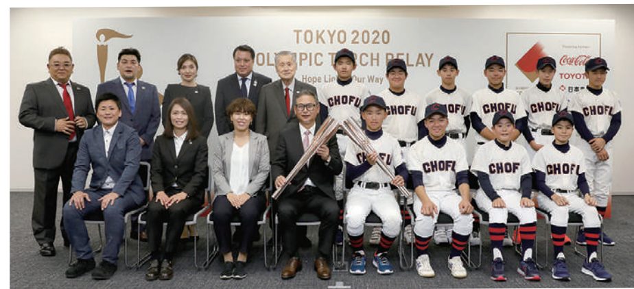
都内で行われたオリンピック聖火リレー記者会見の様子

昨年全国制覇し、世界選手権で準決勝に進出するなど、世界でも大活躍した名門チーム「調布リトルリーグ・リトルシニア」が、グループランナーとして東京都内を走行することが決定しました。