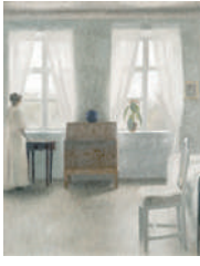
ヴィルヘルム・ハマスホイ「寝室」1896年 ユーテボリ美術館蔵

開往復はがきまたはEメール(☎seibuk@w2.city.chofu.tokyo.jp)に住所、氏名(ふりがな)、電話番号、保育希望者は子どもの名前と年齢を明記し、1月29日(火)(必着)までに申し込み