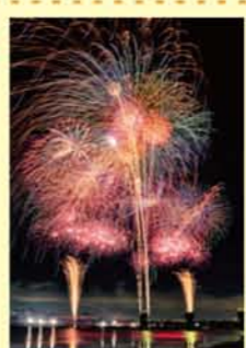
第8回映画のまち調布花火フォトコンテスト最優秀賞受賞作品「静乱」

昭和8年に始まって以来、毎年30万人以上が訪れる調布の花火。平成26年からは「映画のまち」を冠し開催しています。音楽と花火がコラボする「ハナビリユージョン」では、映画音楽を使用するなど、見て・聞いて楽しい花火です。