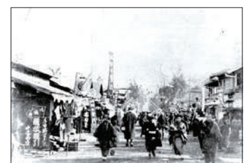
1910年 布多天神「暮の市」