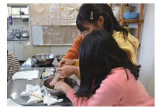
昨年の工作講座の様子

◎往復はがきの往信面に希望講座名、応募者全員(1枚2人まで)の郵便番号、住所、氏名(ふりがな)、年齢、電話番号と、返信面に自身の宛先を明記し、3月1日(日)(必着)までに実篤記念館へ。