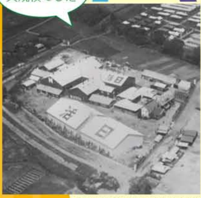
日活撮影所と日活村(昭和9年頃)

調布は都心からの利便性に優れているだけでなく、フィルム現像に欠かせないきれいな水と土地、時代劇に適した土手などの風景があったことから、昭和8年に多摩川撮影所(現在の角川大映スタジオ)が作られました。昭和30年代の日本映画全盛期には、大映・日活に加えて中央映画撮影所(昭和35年撤退)の3カ所で映画が制作され、調布は東洋のハリウッドと呼ばれるようになりました。現在も市内には、角川大映スタジオや日活調布撮影所をはじめ、現像所や小道具の会社など、40社以上の映画・映像関連企業が集まっています。