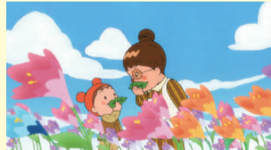
「ハルのふえ」 ©やなせたかし/ TMS

期 3月7日(土) ①上映/第一部:午前11時~、第二部:午後2時~(各回30分前開場) ②ワークショップ/午前10時~午後4時 所 グリーンホール①大ホール②小ホール 内 ①やなせたかしシアター「ハルのふえ」(2012年/カラー/48分) 「アンパンマンが生まれた日」(2012年/カラー/10分) ※各回上映前に短編アニメーション作品を上映②くさぶえ作りなど、作品内容に合わせた子ども向けの工作 費 無料 ※ワークショップ一部有料 他 当日午前10時から、グリーンホール大ホール入口で入場整理券を配布