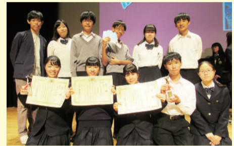
明治大学付属明治高等学校映画部

日 3月8日(日) 午前11時~正午 所 文化会館たづくり8階映像シアター 内 ①最優秀賞・演技賞ダブル受賞作品 作品名/「君との音色」(15分) 学校名/明治大学付属明治高等学校 ②優秀賞受賞作品 作品名/「からっぽ」(8分) 学校名/成城学園高等学校メディアアート部 定 当日先着100人 費 無料