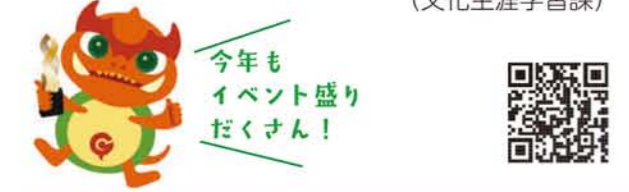
図3月8日(日)まで 図文化会館たづくり、グリーンホール、イオンシネマシアタス調布 図詳細はシネマフェスティバル図参照(下記2次元コードからアクセス可) 図(公財)調布市文化・コミュニティ振興財団文化・コミュニティ事業課 ☎441-6150 (文化生涯学習課)

上映会や「映画のまち調布賞」授賞式をはじめ、展示やワークショップなど、各種関連イベントを約1カ月にわたり開催する映画のお祭りです。