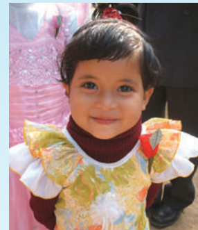
おめかしをしたガロ族の女の子

所 申 調 7月7日(火)午前10時から電話または直接北部公民館 ☎488-2698へ