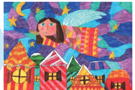
平和首長会議の2018年受賞作品 最優秀賞 ロシア・クラスノダール市 アナスタシア・スコベルツィナさん(9歳)