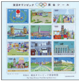
東京オリンピック募金シール