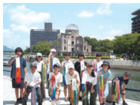
広島平和派遣事業

ふるさと納税ポータルサイト「ふるさとチョイス」から申し込み、または寄附願(市HPから印刷可)を直接、または郵送・FAXで〒182-8511市役所4階管財課 ☎481-7173・☎481-6454へ