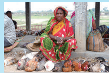
市場でニワトリを売る女性