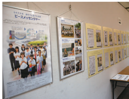
昨年度の展示の様子