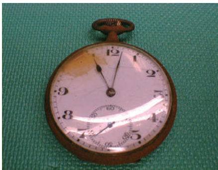
原爆投下時刻で止まった時計 (長崎原爆資料館所蔵)