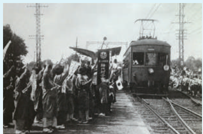
出征兵士を見送る様子(昭和13年頃に金子駅で撮影)