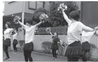
チエリーズによるオープニング発表