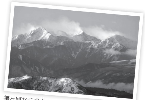
美ヶ原からの北アルプス連峰