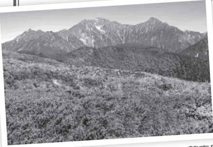
乗鞍からの穂高岳