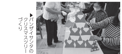
パンザイサントのブリスマスツリーの

展示では他に、公民館近隣からの出展参加がありました。城山保育園の園児による創作物、神代中学校、晃華学園中学校高等学校による美術作品、上ノ原地区生け花子ども教室による生け花作品などが賑やかに並び、多くの方にご観覧いただきました。