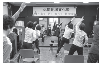
健康体操クラブの体験の様子