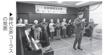
神代女声コーラスの発表