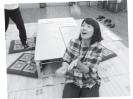
失敗してもだいじょうぶ。 挑戦は何度でもできます!