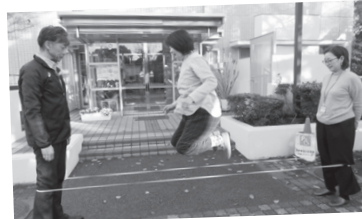
ゴムだんあそびは、軽やかに飛んで跳 ねて競います。ぐーぱー、ぐーふみ、 ぐーぱー、まわってチョン。簡単だけ ど高さがでてくると難しいよ。