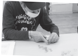
おはじきあそびレベル1。おはじ きをひたすら重ねていくゲーム。 重ねた数を競います。