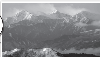
美ヶ原からの北アルプス