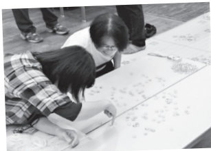
おはじきゲームのルールは簡単。 ただ集中力がいらいます。とっ たおはじきの数を競います。