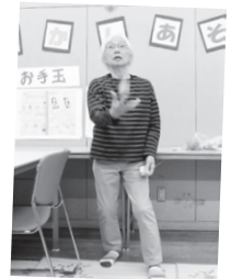
お手玉はしゅんぱつ 力が必要です!