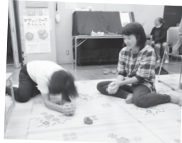
思いっきり悔しがることも たいせつです。