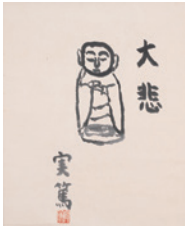
実篤 地藏「大悲」1975年(90歳の作) 個人蔵