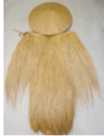
スゲで編んだカサとミノ

郷土博物館公式X(旧ツイッター、@chofu_museum)では収蔵資料紹介などの情報を発信中です。