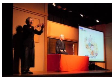
字幕版！絵ばなし寄席（手話付き）