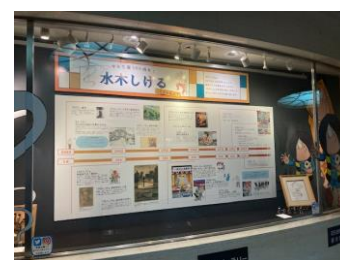
ゲゲゲギャラリー