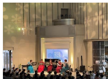
小さな小さな音楽会