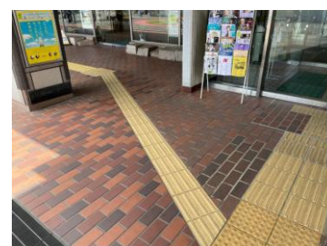
バリアフリー推進