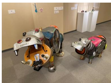
クリエイティブ・リユースでアート！ TAC

美術展関連文化講演会は、都内又は近郊の美術館で開催される展覧会の主催団体と連携し、市民の学習ニーズに応える事業を実施します。