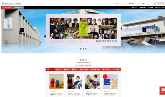
財団ホームページ

調布の文化芸術に関する情報プラットフォーム形成に向けて、文化施設、文化団体、大学等の教育機関と連携しながら調査検討を進めます。また、調布フィルムコミッションの推進のため、映画、ドラマなどの撮影支援を積極的に行います。