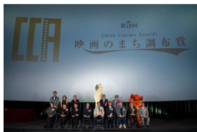
映画のまち調布賞 授賞式