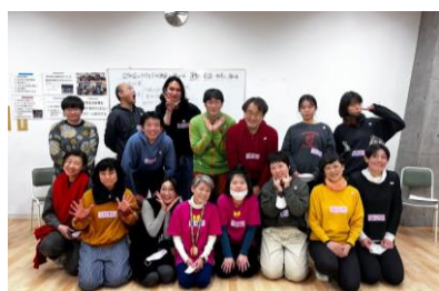
デル育成認定プログラム