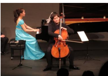
新進演奏家コンサート