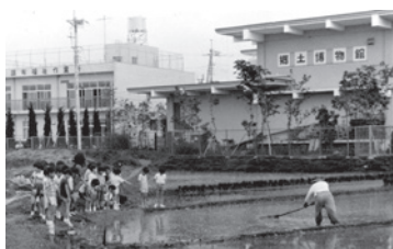
郷土博物館裏の水田(昭和50年代初め)

●修繕工事と資料燻蒸のための臨時休館 期 7月19日(金)まで 他 埋蔵文化財発掘の届け出・問い合わせは、通常通り博物館、6月24日(月)は分室の臨時窓口(布田6-61) ☎042-471-7651) ●次回展示予告 開館50周年記念企画展「農村のくらしと技術」(1階展示室) 開館50周年という節目に、博物館が作られるまでの動きや、開館当時の様子を振り返るとともに、当時市民から寄せられた資料を中心に調布のルーツである農村のくらしと技術に関する展示を行います。 期 7月20日(出)～12月1日(日) 費 無料