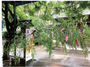
国領夏まつり七夕