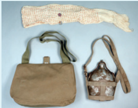
戦争資料の千人針(上)、雑嚢(左)、水筒(右)(郷土博物館所蔵)