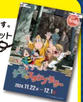
スタンプラリー-台紙 (イメージ)