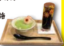
(例)「甘味 an&」限定メニュー

・ゲゲゲ忌期間限定サービスの実施 水木作品のキャラクターにちなんだ商品の販売や企画を行います。