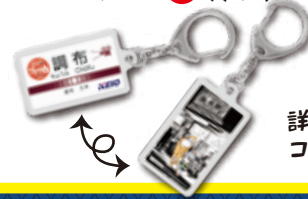
限定駅名キーホルダー(イメージ)