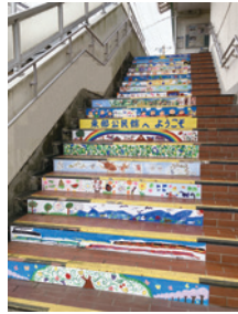
令和4年度の階段アート