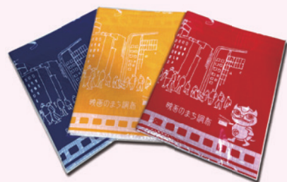
映画のまち調布レジャーシート