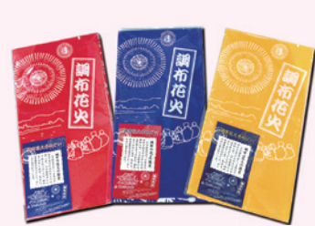
調布花火オリジナル手ぬぐい

調布と花火がコラボした大人気のオリジナルグッズを販売しています。 グッズ/調布花火オリジナル手ぬぐい800円、映画のまち調布レジャーシート800円 販売場所/調布市花火実行委員会事務局(文化会館たづくり11階)ほか ※当日は会場でも販売