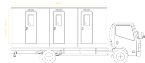
運転席側イメージ