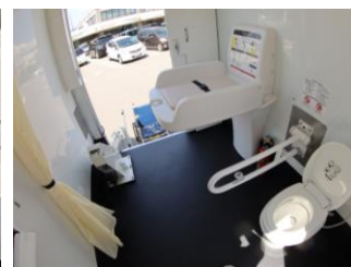
多機能トイレ室内のイメージ