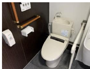
通常トイレ室内のイメージ