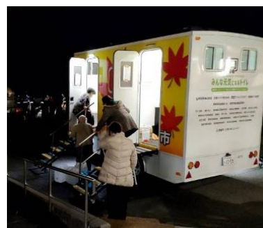
能登半島地震での支援の様子