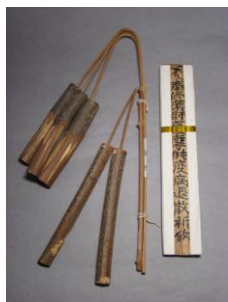
アワボヒエボと護摩札

調布では、1月15日の小正月に「アワボ、ヒエボ（粟穂、稗穂）」とか、「アボヘボ」というものを木肌の軟らかいカツンボで作りました。これは大正半ばまで食べられた粟、稗のその年の豊作を神に願うものです。