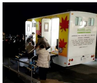
能登半島地震での支援の様子