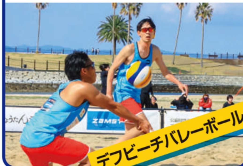
デフビーチバレーボール