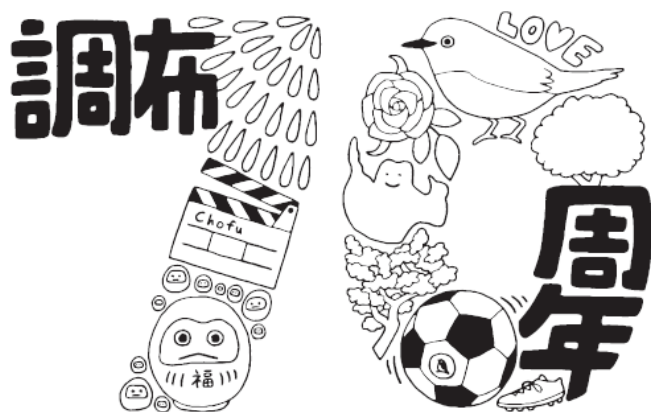
モノクロバージョン

メインの70周年ロゴです。横40mm以下で使用する場合は Chofu 70th Anniversary とロゴ下にテキストが入っているものをお使いください。