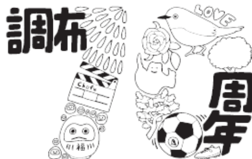
Chofu 70th Anniversary