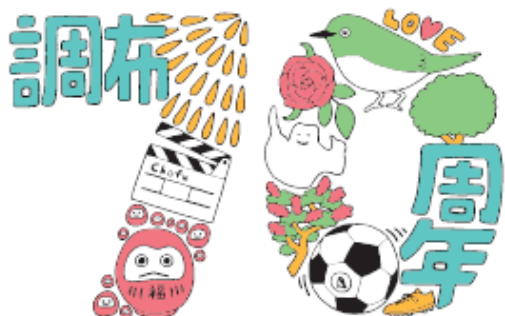
Chofu 70th Anniversary