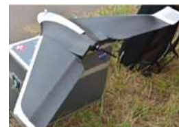
無人航空機（ドローン）

○市が、狛江市及びNPO法人と「災害時における無人航空機（ドローン）を活用した支援活動等に関する協定」を締結（2017（平成29）年3月）したことを契機に、近隣自治体に協定の輪が広がりました。より広域的に連携することで、大規模災害発生時に、市区域を越えて被災状況を迅速に把握することができ、自治体の災害対応能力の向上につながっています。