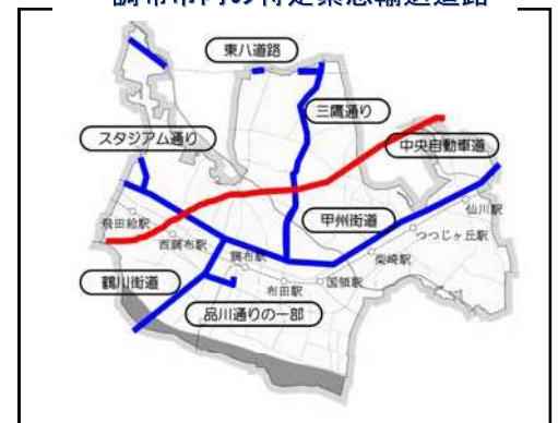
調布市内の特定緊急輸送道路