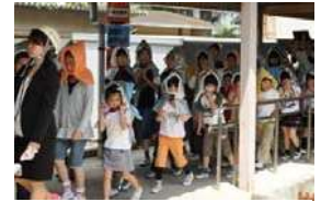
調布市防災教育の日 における防災訓練の様子