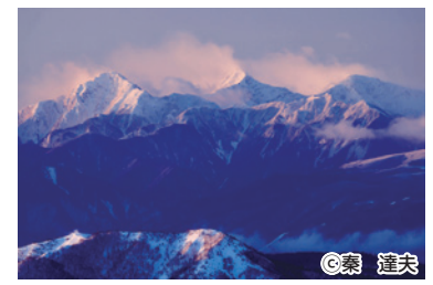
美ヶ原からの北アルプス