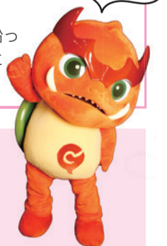
「映画のまち調布」応援キャラクター ガチャウ ©株式会社角川大映スタジオ