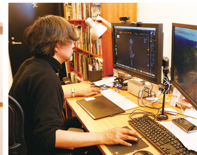
制作期間は調布スタジオに常駐し、スタッフとともに製作に集中している

『ゴジラ-1.0』の場合、掘って立てた小屋や廃屋などバラックのミニチュアを作りましたが、とても汚れているし、雑然としている物がたくさんあります。そうしたものをCGで一つ一つ作ると時間がかなり掛かりますが、ミニチュアであれば、少ない時間で比較的簡単に本物に近い仕上がりのもので制作することができます。また、複雑に動かさなければならぬ場合はCGの方が優位性は高いですが、バラックやそこに存在していれば良いもの、あまり動かない