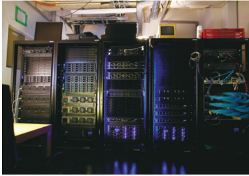
▲制作に欠かせない膨大なデータを管理するサーバールーム

▼多くの作品が生まれてきた撮影スタジオ。映像を作り上げるのに必要な機材やモーションコントロールカメラが中央に陣取っている