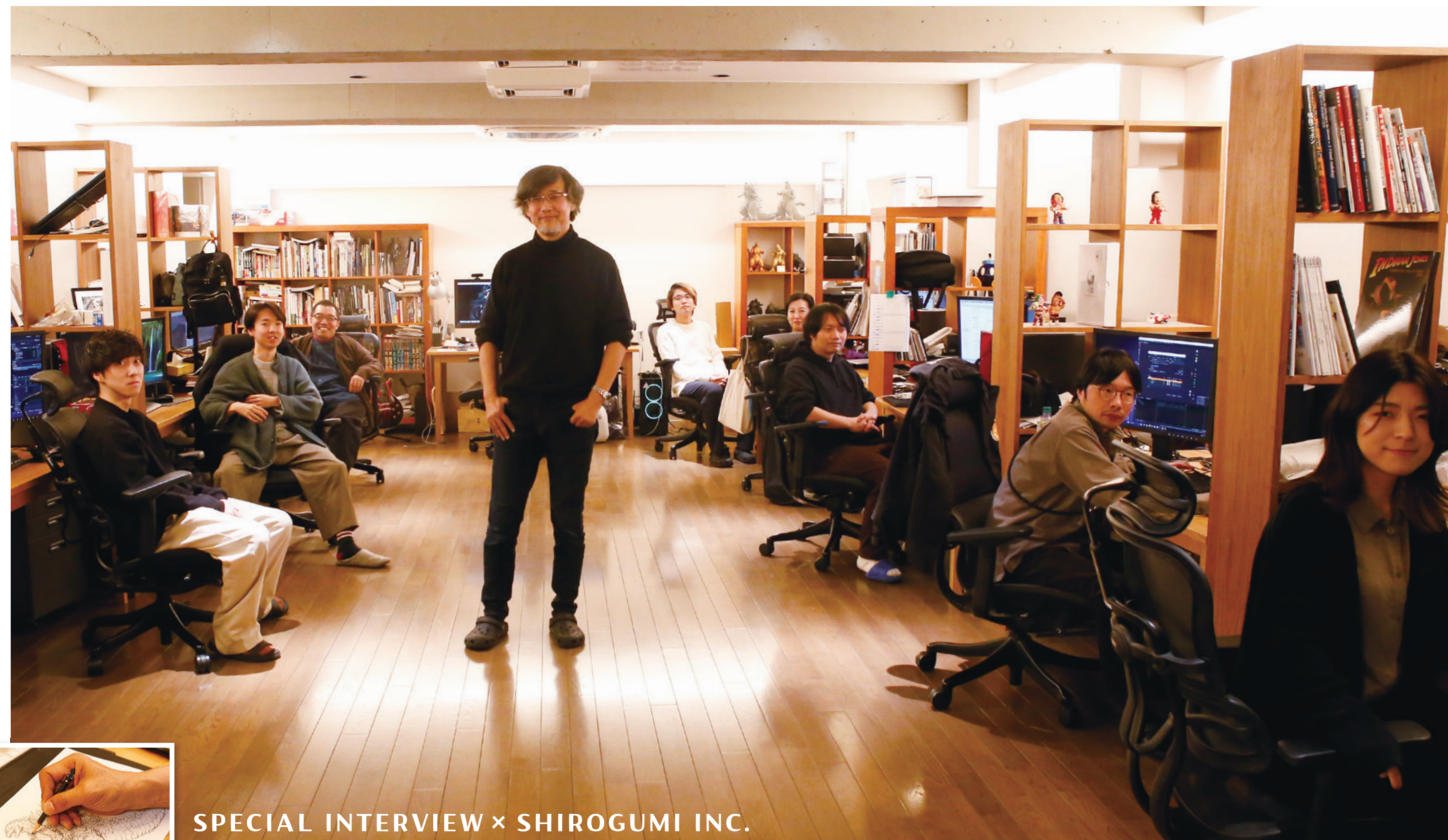
SPECIAL INTERVIEW × SHIROGUMI INC.