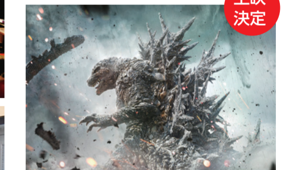
映画のまち調布 シネマフェスティバル2025 上映日時:3月2日(日)午後3時~ 映画のつくり手に贈る映画賞【第7回映画のまち調布賞】の録音賞、編集賞の受賞作品。また、株式会社白組は、同映画賞の特別賞を受賞しています。

「ゴジラ-1.0」 2023年11月3日公開した白組 山崎 貴による、ゴジラ生誕70周年記念作品。第96回 アカデミー賞®ではアジア映画初となる視覚効果賞を受賞。VFXは白組 調布スタジオが担当した。