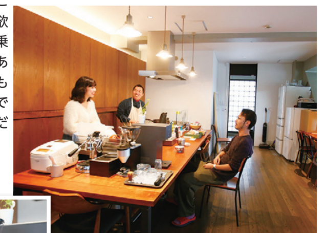
スタジオの一角に備えた空間。食事や休憩をしたり、スタッフ同士のコミュニケーションの場にもなる

若い人たちは、困難な仕事に放り込まれた時に、ただ頑張るだけではなく、困難の中でも楽しむことができる人に育てて欲しいですね。情熱だけで乗り越えられないこともあると思いますので、情熱も持ちつつ、楽しむことができる才能はとても大切だと思います。