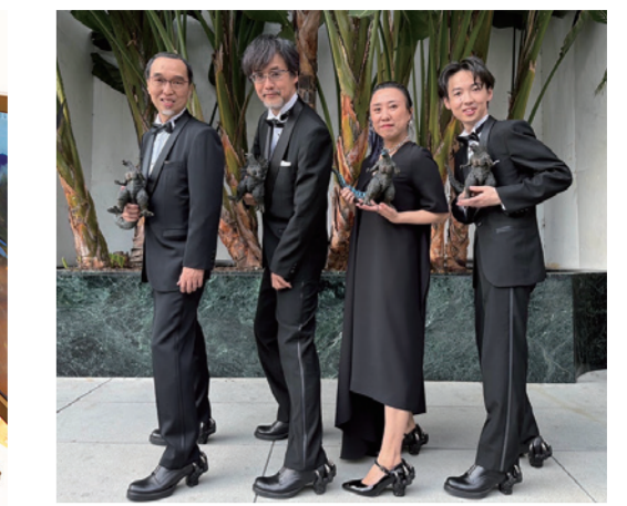
第96回 アカデミー賞® 受賞式の一瞬。4人が履く靴のかかとには鋭い爪のゴジラの手が

「ゴジラ-1.0」 2023年11月3日公開した白組 山崎 貴による、ゴジラ生誕70周年記念作品。第96回 アカデミー賞®ではアジア映画初となる視覚効果賞を受賞。VFXは白組 調布スタジオが担当した。