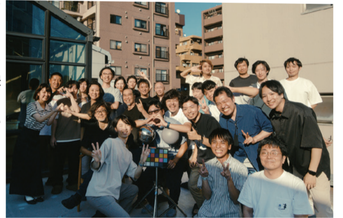
白組のスタッフの皆さん

白組の作品を観る時は、「調布で制作しているんだな」と意識してもらえると嬉しいです。『ゴジラ-1.0』で視覚効果賞を受賞した時は、市内のたくさんのお店でお祝いのポスターを貼っていただいていたのが嬉しかったです。市民の皆さんにはご当地映画として、観ていただけたらと思っています。