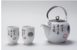
実篤の絵柄の急須と湯呑 瀬米陶器製

「生活を彩った実篤グッズ」 身の回りに実篤グッズがあふれた時代、人々が実篤の書画に求めたものを探ります。