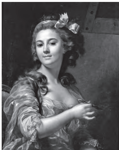
マリー＝ガブリエル・カベ《自画像》1783年頃、 油彩／カンヴァス、国立西洋美術館

国立西洋美術館で3月から開催する展覧会では、サンディエゴ美術館のコレクションとともに、14世紀から19世紀までの約600年におよぶ西洋絵画作品が展示され、美術鑑賞初心者にも楽しめる内容となっています。