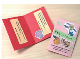
実篤名ゼリフBOOK 完成品