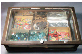
昭和の駄菓子屋ケース