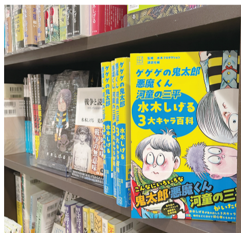
▲水木しげるさんやつげ義春さんなど、市にゆかりのある作家のコーナーも充実！