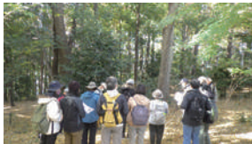
ボランティア活動の様子

調布に今も残る里山の風景や雑木林を、市民と市が協働で保全していくためのボランティア養成講座です。 日・時①5月24日(出)・オリエンテーション②6月14日(出)・雑木林の保全作業と安全管理③7月19日(出)・雑木林の生態系(植物編)④9月20日(出)・雑木林の生態系(昆虫編)⑤10月25日(出)・雑木林の恵みを体験⑥12月13日(出)・市内樹林地見学バスツアーとワークショップ 時 午前10時～午後3時(予定) 所 野外活動ができる18歳以上の方 定 申し込み順20人 費 1500円(ボランティア保険料、テキスト代) 申 4月10日(休)～24日(休)に申し込みフォームから申し込み、またはEメールでちょうふ環境市民会議 ☎info@chofu-kankyo-shimin.org ☎環境政策課☎042-481-7086