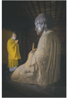
深大寺元三大師像