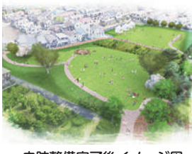
史跡整備完了後イメージ図