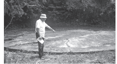
▲大津（茨城県）放球台

戦争末期、風まかせに米国本土を攻撃した最終兵器の風船爆弾。女学生等がその製造に動員され、和紙とこんにゃくで作られた気球です。この製造に三多摩（調布）も無関係ではありませんでした。私たちの街の昔と風船爆弾のつながりを考えます。