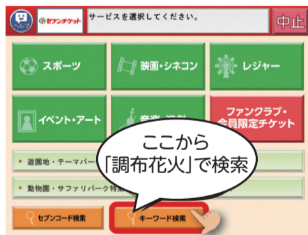
マルチコピー機画面

セブンイレブンのマルチコピー機から、キーワード検索に「調布花火」と入力してチケットを購入(発券手数料なし)