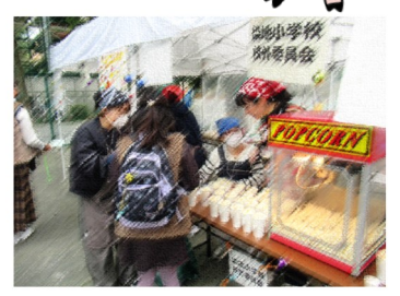
おやつコーナーも 大盛況！