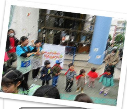
乳幼児さんによる アンパンマン体操！