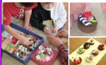
工作の会でプチケーキを作りました♪