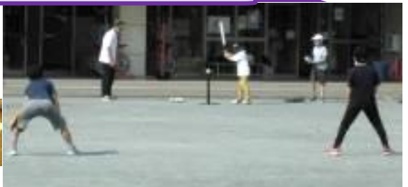
2/12「ソフトボールやってみよう!」の様子です!