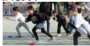
人気のイベント「かけっこ教室」の様子です。