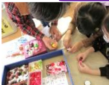
工作の会でプチケーキを作りました♪