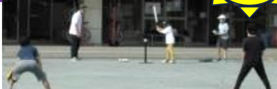
毎月1回「ソフトボールやってみよう!」があります! 誰でも参加できます♪