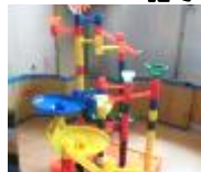
大人気のおもちゃ「くみくみスロープ」