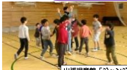
出張児童館「ジャンジャン」楽しかったね♪