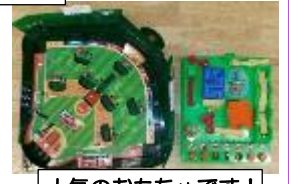
人気のおもちゃです！