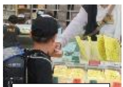
来た時、帰る時に受付をします