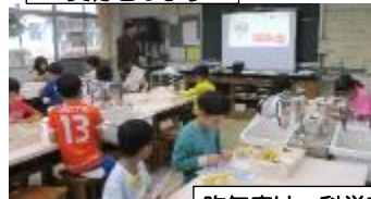
昨年度は、科学実験教室や、ダンス教室もありました。