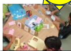
みんな楽しみにしている「工作の会」