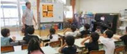
囲碁教室の様子です。