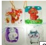
2月「プラ板工作」の様子です！