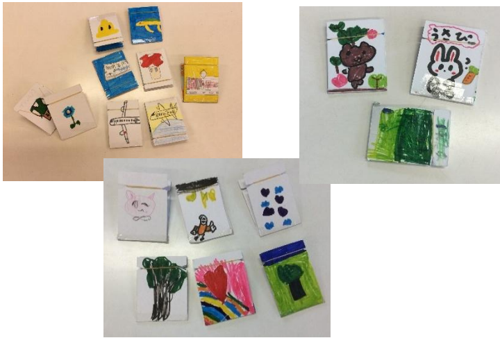
がつこうさくしゅうかんさくひん *4月工作週間作品「おどかしパッチン」