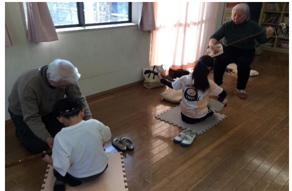
しゃみせんきょうしつ ようす *三味線教室の様子