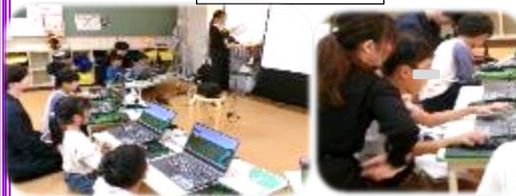
プログラミング教室