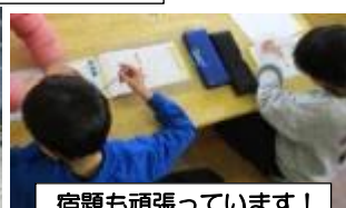
宿題も頑張っています!