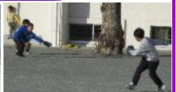
宿題が終わったら…寒さにも負けず校庭や体育館で遊んだね♪