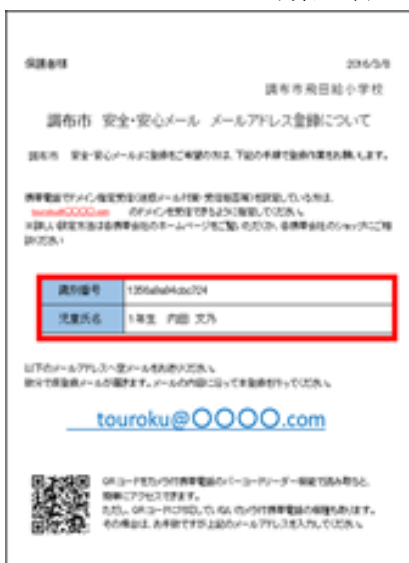
メールアドレス登録案内書

※児童ごとに固有の識別番号が記載されています。 ※イメージですので実際の文書とは異なります。