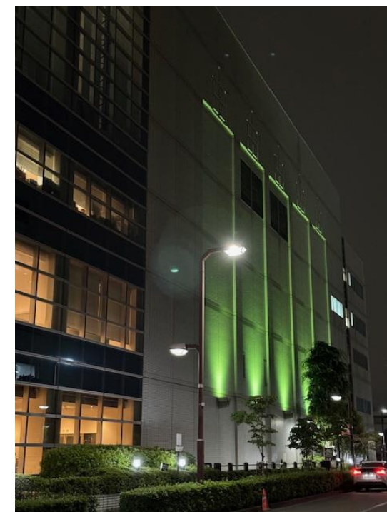
ライトアップの様子