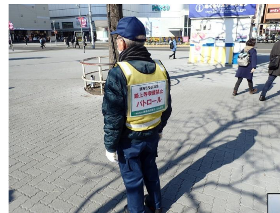
路上等喫煙防止指導員