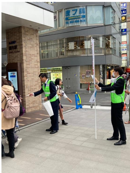
キャンペーン当日の様子

文化会館たづくり, 医師会館, 歯科医師会, 薬剤師会, 医療機関にてライトアップ実施