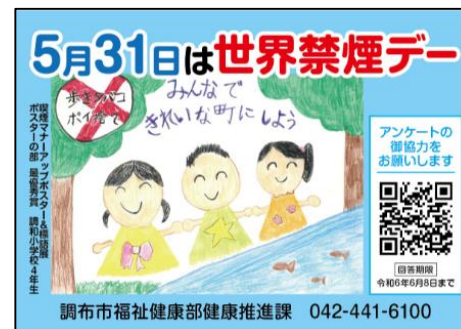
ポケットティッシュデザイン