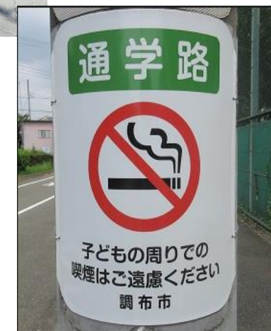
通学路 電柱巻き看板