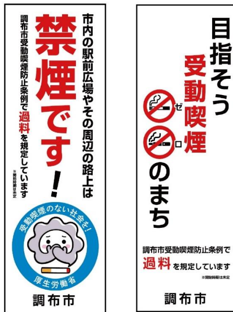
のぼり旗デザイン