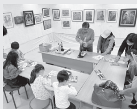
▲オリジナル缶バッジのお給 かき

▶「レストラン」を テーマにした笑い あり、緊張感あ りのアクロバ ットサーカス! 参加者も飛び 入り参加