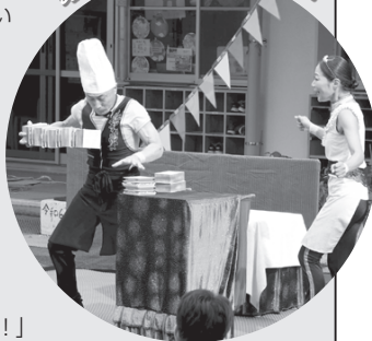
▲かくれちょこぼん を見つける 「ちょこぼんを探せ!」