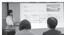
▲桐朋女子クイズ研究会 「元気」「人生100年時代」 に関連した問題を出題