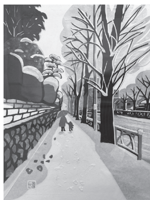
「甲州街道 雪」▶ 遠藤さみ子

ここ約 10 年間の 公民館活動を支えて きたサークル講師と 事業の講師による作 品展。