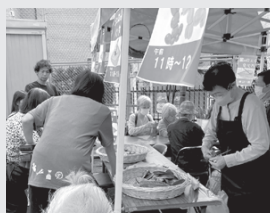
▲シュロの葉パッタ 隣ではバルーンアート