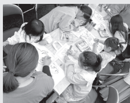
▲エコバッグ、ポストカード のお絵かき