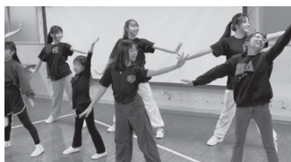
▲桐朋女子ダンス部&キッズダンス 50周年イメージソング♪ 「Special Days」