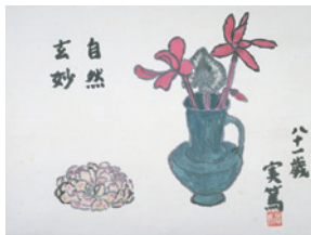
実篤 シクラメン「自然玄妙」1966年