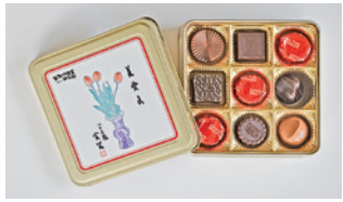
2026年限定チョコレート