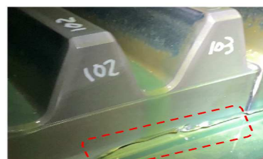
大ギアの変状状況