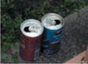
空き缶・ペットボトル