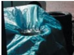
雨よけシートのくぼみ