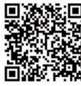
申請書ダウンロード

調布市受動喫煙ゼロの店登録申請書をFAX・メールまたは健康推進課の窓口にて提出します。対象施設は市内飲食店です。 ※申請書は健康推進課の窓口、公共施設等で配布しています。調布市ウェブサイトからダウンロードすることもできます。