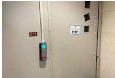
バリアフリー推進（トイレ自動ドア設置）