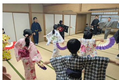
日本舞踊体験 「弧の会と踊ろう」