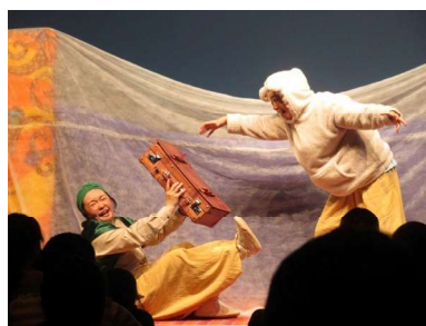
おらほせんがわ親子向けミニシアター