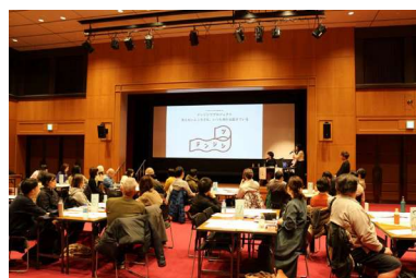
テンジツプロジェクトトークセッション