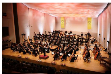
調布国際音楽祭 2025

障害の有無にかかわらず、共に創作ダンスを楽しむ事業として、成果発表会に向けて、年間を通じてワークショップを開催しました。あわせて、地域の生徒が、自由で多様な身体表現を楽しむ機会として、中学校等のインリーチ事業を実施しました。