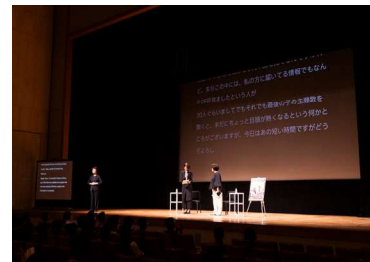
ユニバーサル上映会