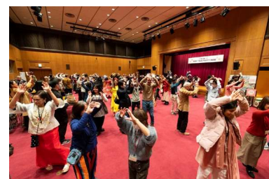
ニューイヤーパーティー2026