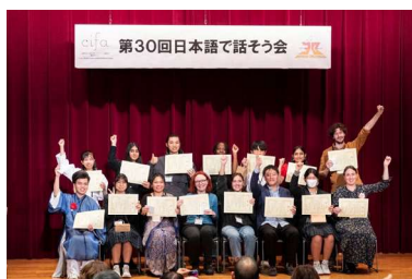
第30回日本語で話そう会