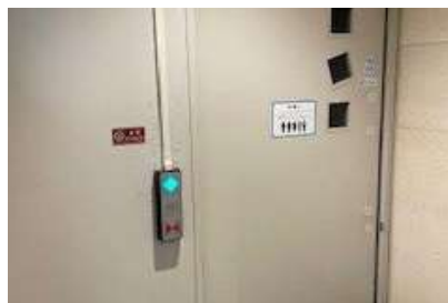
バリアフリー推進(トイレ自動ドア設置)