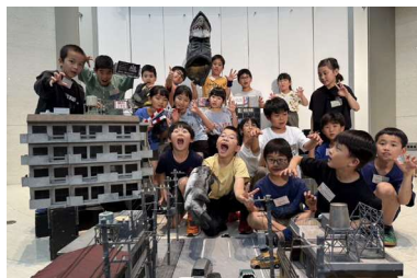
大怪獣大暴れワークショップ