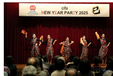
ニューイヤーパーティー