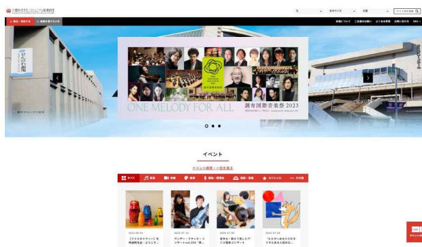
財団ホームページ

会員制度「ちょうふアートプラス」については、市内の無料会員を含めた会員数の増加を目指すとともに、賛助会員制度を新たに創設することで、財団事業の支援者の拡大を図ります。また、市外の有料会員の継続率向上により、収支面での安定化を図ります。