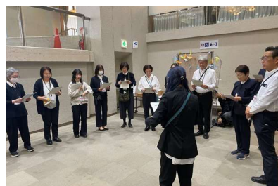
開演前スタッフ打合せの様子②