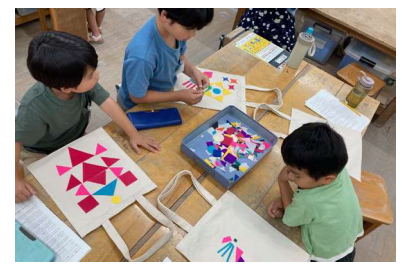
子ども向け美術講座