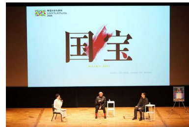
上映会トークイベント