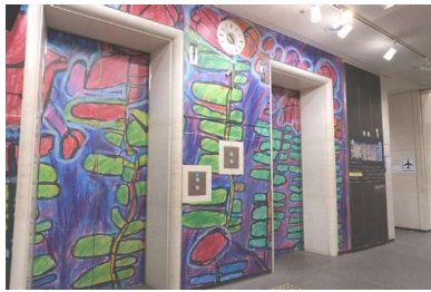
エレベーターホール・アートプロジェクト