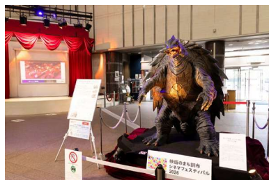
「ガメラ3」立像

映画賞授賞式、映画制作の技術スタッフや監督によるトークショー付きの映画上映会のほか、上映作品に関連した小道具や設計資料、調布市立図書館所蔵の映画資料の展示や、プロの映画製作の技術スタッフが指導する撮影体験ワークショップなど、各種プログラムを展開します。