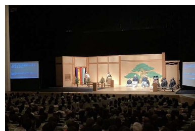
字幕・解説付き「能・狂言」公演