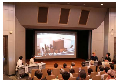
テンジシツプロジェクトトークセッション