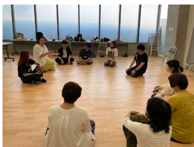
DEL（デル）認定プログラム

市内中学校演劇部へのアウトリーチを実施し、アーティストとの交流を通して演劇創作のプロセスを共有します。部活動を支援する地域モデルとして、文化芸術教育の継続的な担い手づくりにもつなげる取組を推進します。