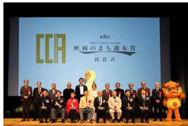
映画のまち調布賞 授賞式