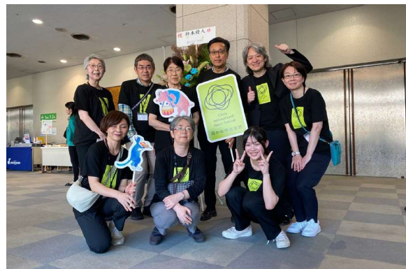
ちょうふアートサポーターズ活動