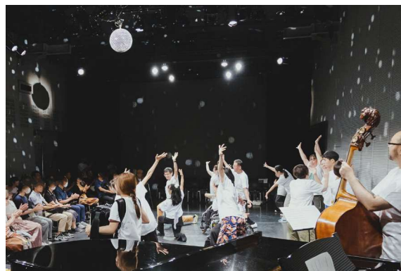
インクルーシブシアター