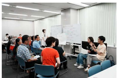
出演者とCASによるワークショップ①