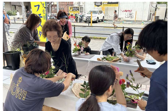
調布市民文化祭 文化フェスタ