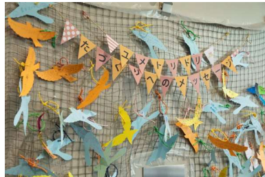
30周年事業「ユメトリドリ～たづくりへのメッセージ～」館内装飾