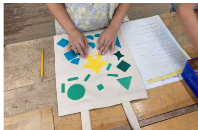
子ども向け講座「○△□ 図形でデザインするトートバッグ作り」

体験から学習へとつなげることで受講生の学びを深めるとともに、より参加がしやすいように29歳以下の割引の導入や子ども向けのワークショップも実施しました。