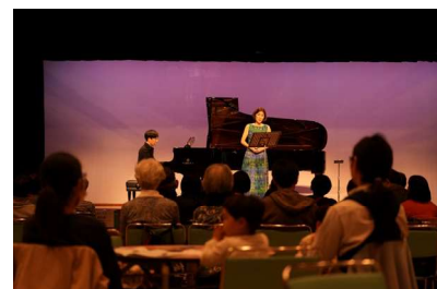
「世界の空に耳をすまして」③