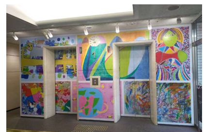
エレベーターホール・アートプロジェクト