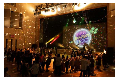
ちょうふ彩映祭「みんなのディスコ」