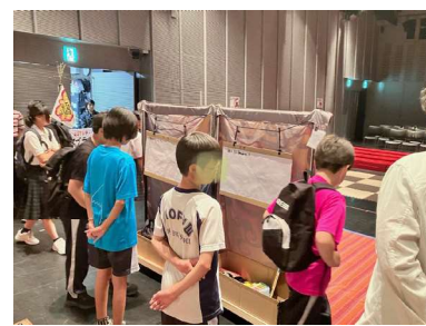
稽古場見学 部活動の地域連携・地域展開