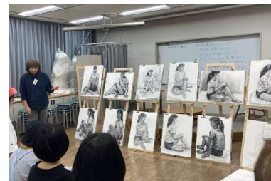
夜間講座「コンテ・木炭デッサン」