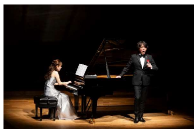
宮本益光バリトンリサイタル