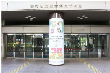
30周年事業ロゴたづくり入口柱巻