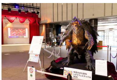
映画のまち調布 シネマフェスティバル 第8回映画のまち調布賞 授賞式 「ガメラ3」立像

これらの取組の過程において、他市行政機関や地域の企業・団体との協力関係を築き、多様な人材・団体との連携、発展的・持続的な協働の観点からも大きな意義を生みました。