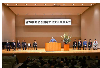
祝70周年記念調布市民文化祭

文化ボランティア「ちょうふアートサポーターズ（CAS）」の活動を推進し、30周年事業の一つとして事業企画・運営、広報活動に取り組みました。そのほか、アクセシビリティ研修では合理的配慮などについて学び、体験することで、日頃の活動につなげる機会を創出しました。