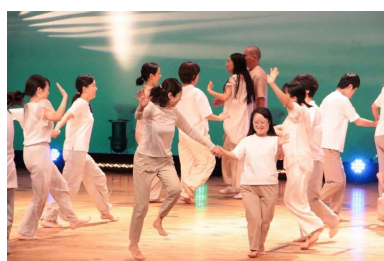
グリーングリーンのはら