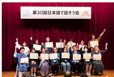
日本語で話そう会

多文化共生事業では、国や民族、文化の違いにかかわらず外国人も共に生活する住民という認識を深めるため、広く市民向けに国際理解のための講座を開催します。