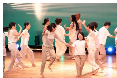
グリーングリーンのはら