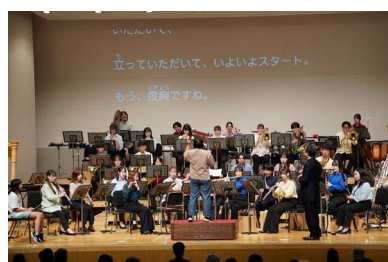
指揮者体験 「グリーンホール・オープンデー」