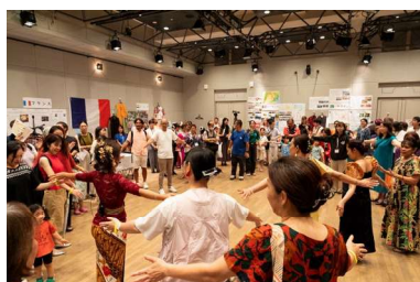
フレンドシップデー2025

交流事業として、隔年で開催しているフレンドシップデーを実施しました。出展者を募り、民族衣装や民族ダンス、子どもの遊びなど、自国の文化を紹介することで互いの文化の理解を深め、参加者同士の交流を図りました。