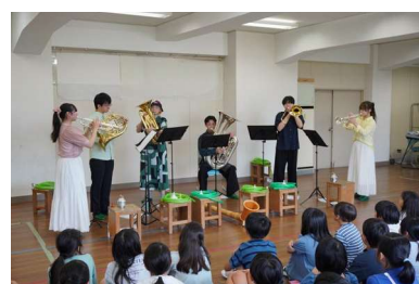
音楽アウトリーチ