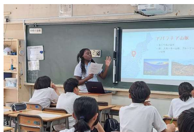
市内中学校講師派遣