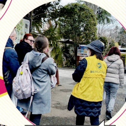
深大寺ボランティアガイド