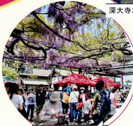
国領千年乃藤まつり