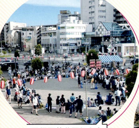
国領駅前盆踊り大会