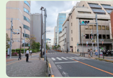
6 R7年度完成 調布都市計画道路 7・5・1号線