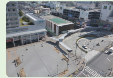
13 H29年度完成 国領駅前広場