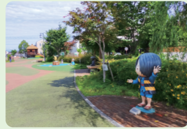
2 R2年度完成 鬼太郎ひろば (水木しげるゾーン)