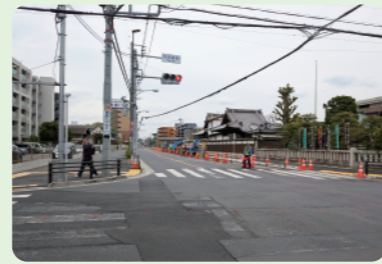
10 R8年度完成予定 調布都市計画道路 3・4・26号線