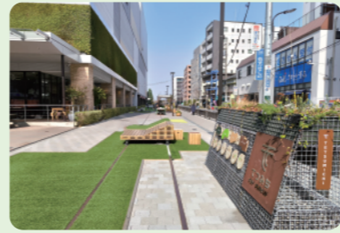
4 R6年度完成 ちょうふぼっぼみち (トリエ京王調布C館北側)