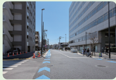
8 R8年度完成予定 調布都市計画道路 3・4・28号線