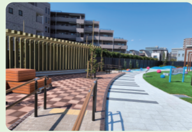
9 R6年度完成 ちょうふぼっぼみち (文化発信ゾーン)