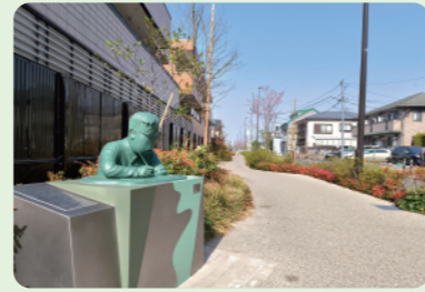
3 R6年度完成 ちょうふぼっぼみち (水木しげるゾーン)