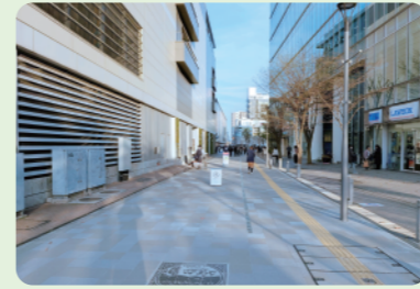
5 R7年度完成 区画道路1号・9号