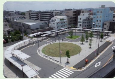
11 H29年度完成 布田駅前広場