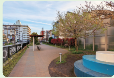
1 R6年度完成 鉄道敷地公園 (映画ゾーン)