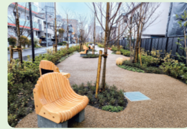
12 R6年度完成 ちょうふぼっぼみち (やすらぎ健康ゾーン)