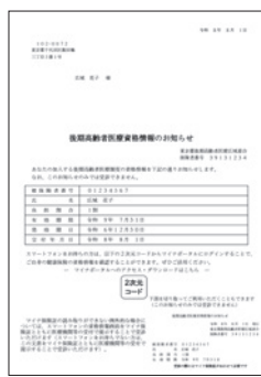
▲資格情報のお知らせ

マイナ保険証の利用状況は、資格情報のお知らせまたは資格確認書の作成時点で判定します。どちらをお送りするかは、発送直前に確定するため、個別のお答えはできません。